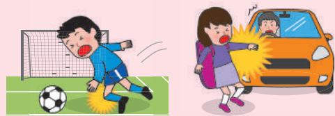
● 団体活動中のケガ ● 団体活動への往復中、車にはなられてケガをした場合

※AW・BW・CW区分にご加入の場合は、上記に加え、「団体での活動中およびその往復中」以外の事故も対象となります。ただし、熱中症、細菌性・ウイルス性食中毒を除きます。