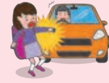
● 団体活動への往復中、車にはねられてケガをした場合