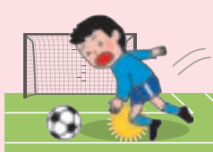
● 団体活動中のケガ

※AW・BW・CW区分にご加入の場合は、上記に加え、「団体での活動中およびその往復中」以外の事故も対象となります。ただし、細菌性・ウイルス性食中毒を除きます。