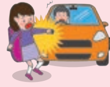
● 団体活動への往復中、車にはねられてケガをした場合